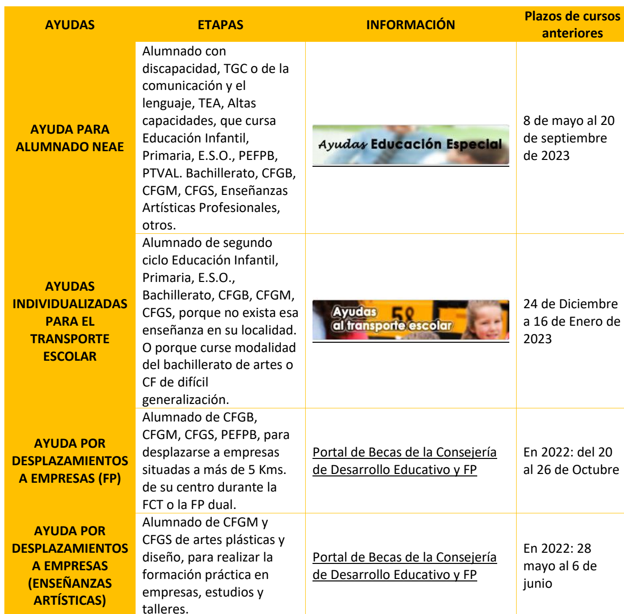
Tabla 27 Ayudas al estudio