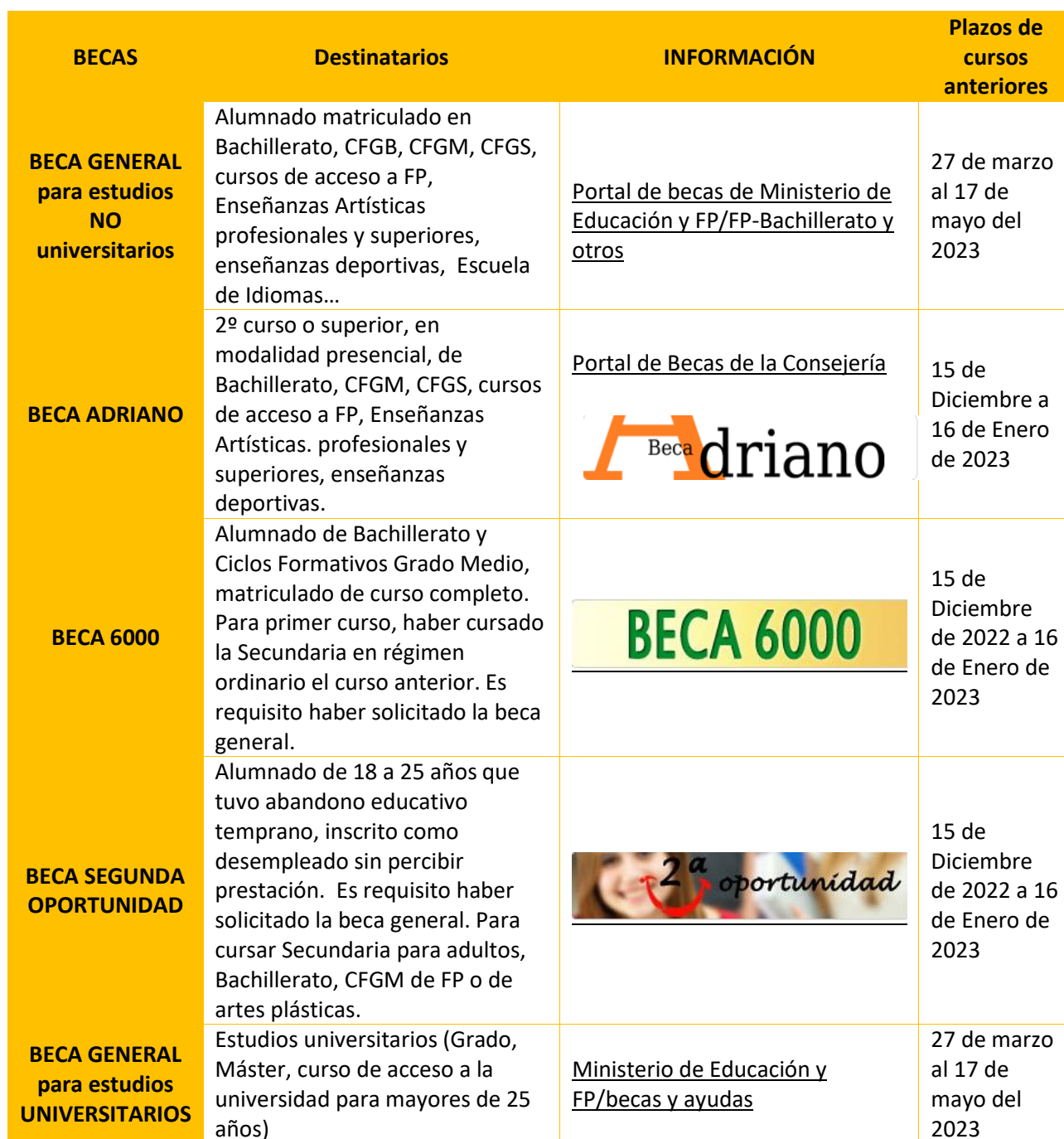
Tabla 26 Becas generales