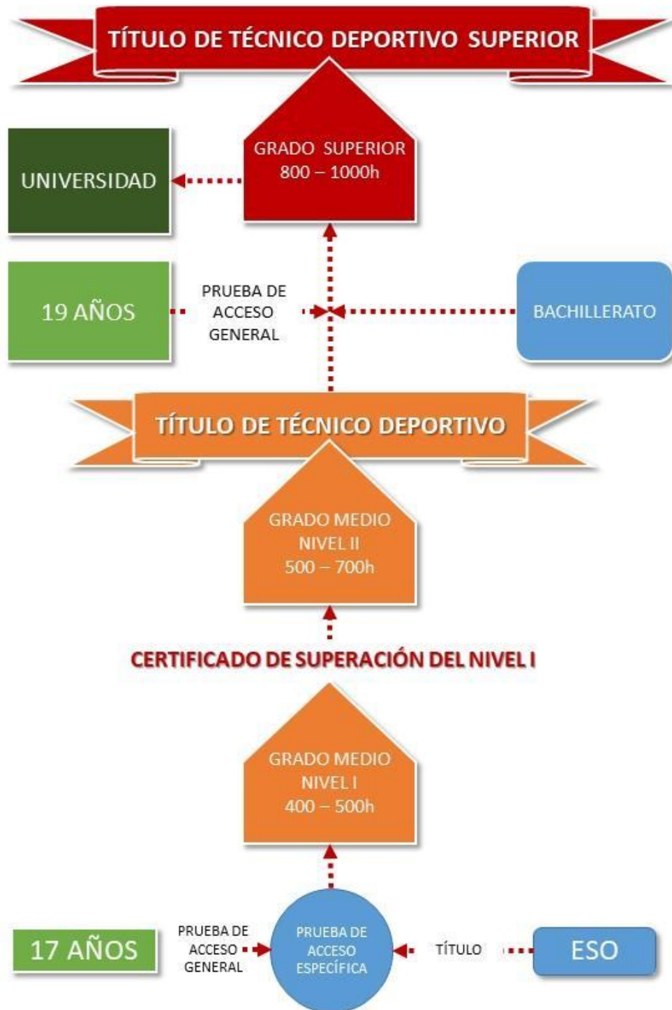
Ilustración 3 EDRE